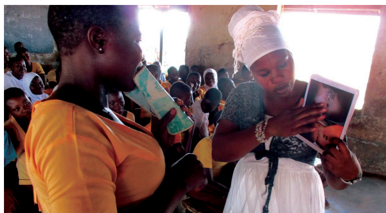
Aufklärung in der Schulklasse

des regulären Unterrichts und entwickeln eigene Aktionspläne mit verschiedenen Schwerpunkten. Dank der Arbeit unserer Projektpartner gehört die Problematik der weiblichen Genitalverstümmelung nun dazu. Teilweise werden erst auf Anregung der Projektpartner Schulclubs gegründet. Ziel ist es stets, die Schülerinnen und Schüler über die Hintergründe dieser Tradition zu informieren und sie über die schwerwiegenden gesundheitlichen Folgen derselben aufzuklären. Auch die Gesetzeslage und das Recht auf körperliche Unversehrtheit werden hier vermittelt. Gleichzeitig tragen die jungen Menschen ihre Erkenntnisse in ihr Dorf und geben sie an ihre Familien und ihre Nachbarn weiter. Für diese Aufgabe werden die Mitglieder der Schulclubs eigens vorbereitet. Sie erhalten außerdem Anschauungsmaterial. Mit dieser Unterstützung erarbeiten die Schülerinnen und Schüler in den Clubs zum Beispiel Theaterstücke, die sie in „ihren“ Dörfern vor bis zu zweieinhalbtausend Zuschauern vorführen. Sie entwickeln auch eigene Ideen und Aktivitäten zur Aufklärung ihrer Mitmenschen wie Malwettbewerbe, Diskussionsveranstaltungen und Frage-und-Antwort-Spiele.