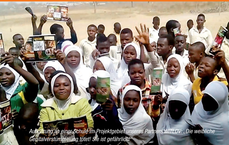
Aufklärung an einer Schule im Projektgebiet unseres Partners WITLOV: „Die weibliche Genitalverstümmelung tötet! Sie ist gefährlich!“